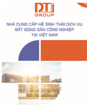
Hồ sơ Công ty