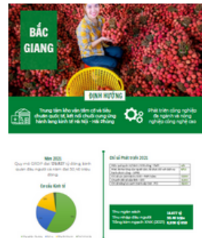
Tỉnh Bắc Giang Tờ gấp