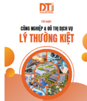
Sổ tay Tổ hợp Lý Thường Kiệt