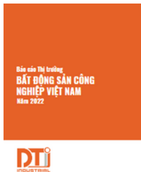
Báo cáo Bất động sản Công nghiệp 2022