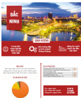
Tỉnh Bắc Ninh Tờ gấp