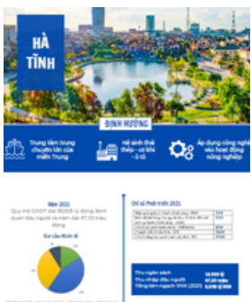
Tỉnh Hà Tĩnh Tờ gấp